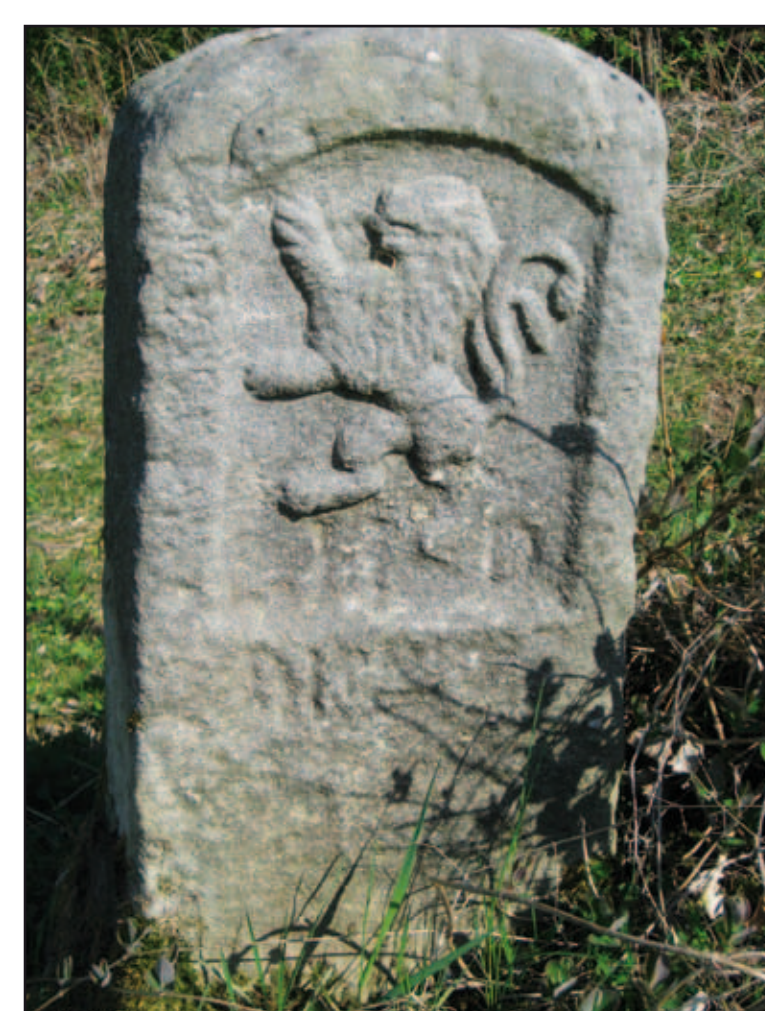
Nr. 7, Stein von 1756

Gruben im Bereich von Engelhausen erwähnt werden, weiterhin von zwei Urkunden über Grenzstreitigkeiten von 1448 und 1485, in denen von „Wege nach Engelhusn und Isenkuten“ die Rede ist. Das Dorf Engelhausen ist seit 1432 Wüstung und befand sich in der Nähe der Engelsburg in Richtung Laubach. Die Reichsgrafschaft Solms-Laubach bestand von 1548 bis 1806 und ging danach in das Großherzogtum Hessen-Darmstadt über.