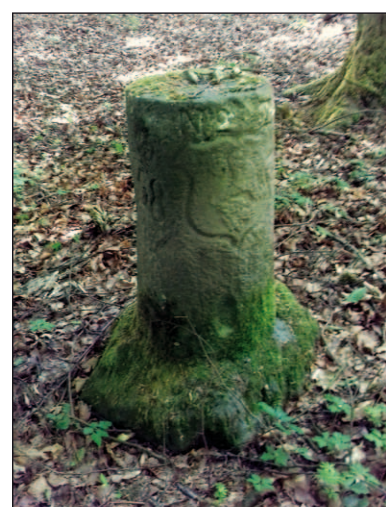
Nr. VII, „Runder Stein“