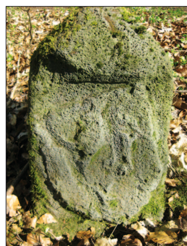
Nr. II am Hatzenberg