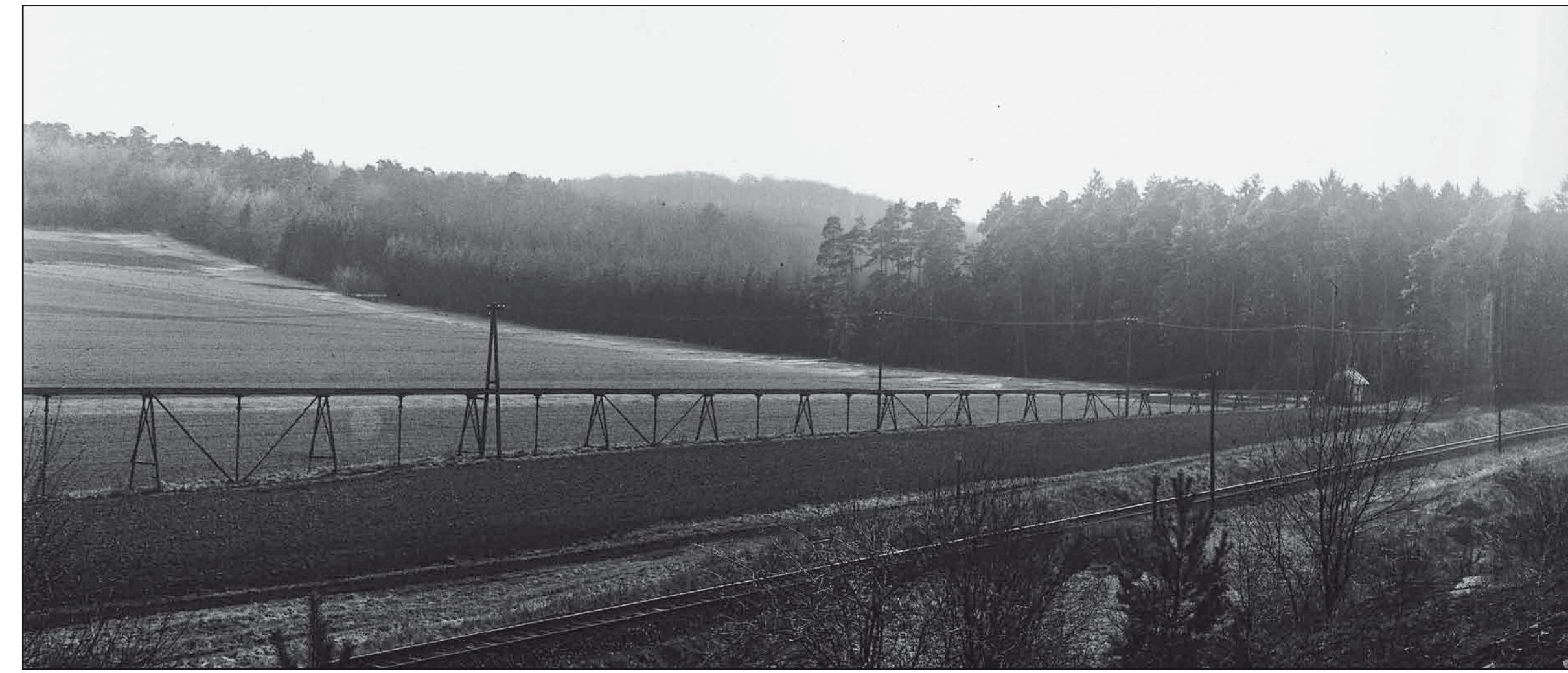
Schlammleitung zwischen den Schlammteichen bei Weickartshain und der Grube Schöne Aussicht bei Freienseen

Die Erschließung des Wascherzes im Tagebau erfolgte ebenfalls vom Süden ausgehend nach Norden und erstreckte sich in dieser Richtung auf fast 750 m Länge. Die Ausdehnung des Grubenfeldes in Ost-West-Richtung betrug bis zu 150 m. Somit wurde ein Gebiet von ca. 11,5 ha erschlossen.