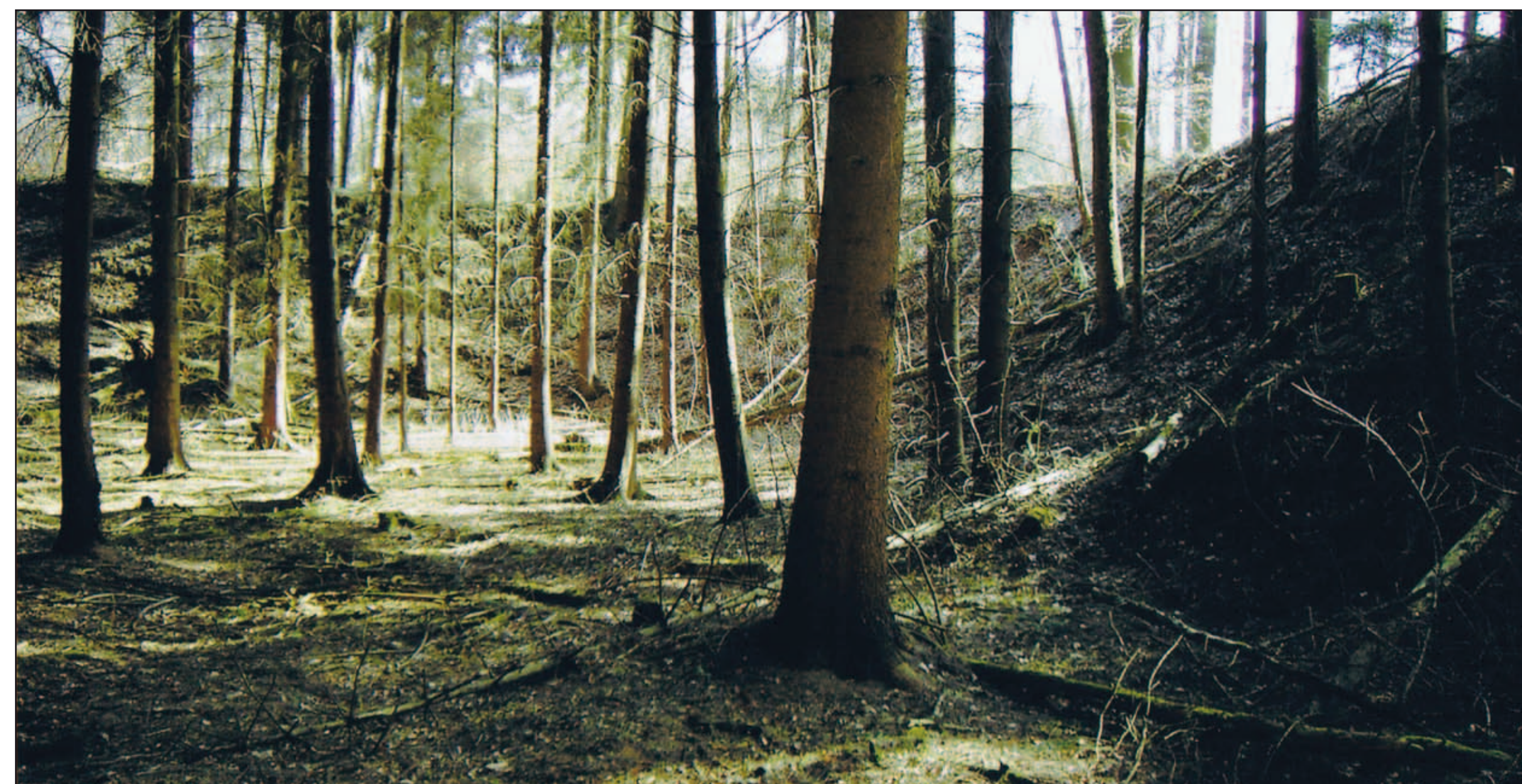
Grube Neugrünende Hoffnung heute

Die Grube Neugrünende Hoffnung war als Tagebaugrube von 1909 bis 1923 in Betrieb. Zuvor wurde im südlichen Randbereich, wie die dort vorhandenen Pingen bezeugen, mittels Schächten Stückerz abgebaut.